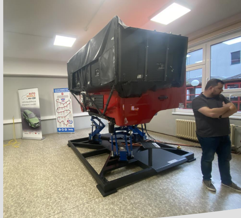
často simulátory zvarania, motorky a kamionu